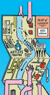
II. Die industrielle Revolution erhält den Popklaps.