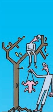
I. Im kühlen Schatten eines Baumes.

Konsortium & Konsorten präsentiert 378 Jahre Artisten, Tiere, Sensationen