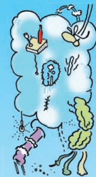
V. Ein Phantasma.